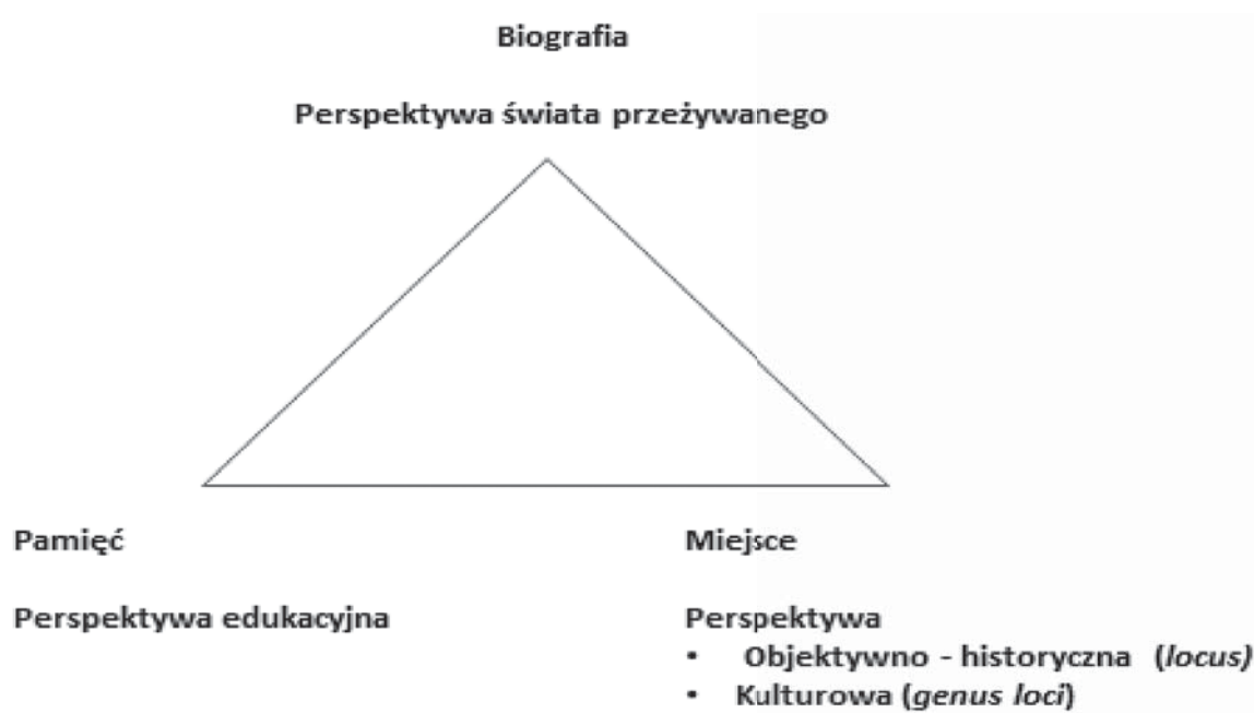
Rysunek 2. Główne metody i techniki badań środowiskowych