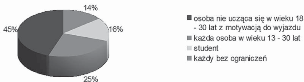
Wykres 2. Wiedza badanych na temat uczestników EVS

Większość badanych знаła kryteria uczestnictwa w projektach Wolontariatu Europejskiego oraz specyfikę pracy, jaką mogą wykonywać wolontariusze. Najwięcej osób – 45% badanej próby – słusznie stwierdziło, że w EVS może wziąć udział osoba nie ucząca się w wieku 18–30 lat posiadająca silną motywację. Wielu respondentów, prawdopodobnie myląc Wolontariat Europejski z wymianami studenckimi, odpowiadało, że w EVS uczestniczą studenci (16% wypowiedzi). Niektórzy badani, 14% wypowiedzi, twierdzili że w Wolontariacie Europejskim może uczestniczyć każdy bez ograniczeń, co oczywiście nie jest prawdą i świadczy o braku wiedzy badanych w tej materii.