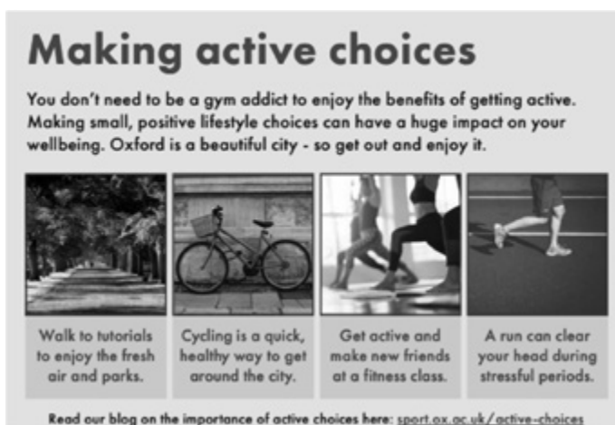
Schemat 1. Forma promowania zdrowego stylu życia