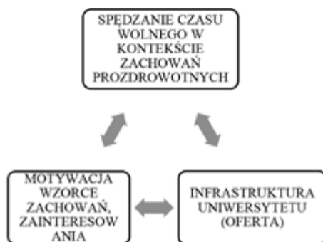
Schemat 3. Konceptualizacja cyrkularności determinantów spędzania czasu wolnego w perspektywie prozdrowotnej