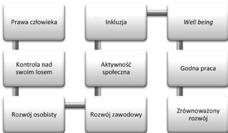
Ryc. 3. Zadania i treści edukacji dorosłych Źródło: opracowanie własne.